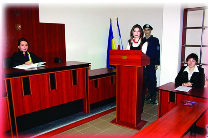
Зал судебных заседаний

Преподавание ведется в современных учебных аудиториях, оборудованных мультимедийными средствами обучения, учебном зале судебных заседаний, криминалистической лаборатории, на криминалистическом полигоне и в лаборатории хозяйственного права.