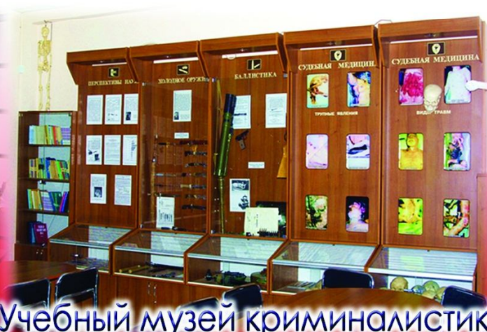
Учебный музей криминалистики и судебной медицины