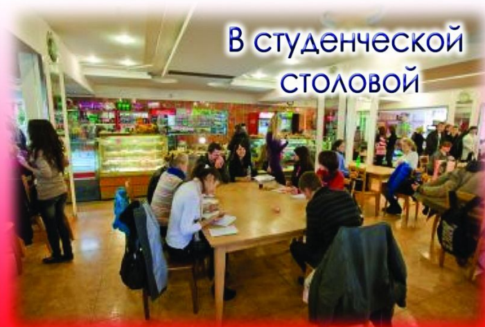
В студенческой СТОЛОВОЙ