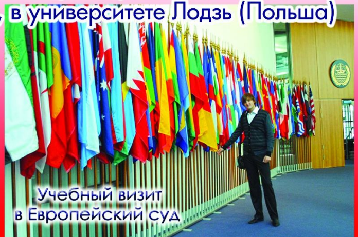
Учебный визит в Европейский суд

На базе центра компьютерных технологий регулярно проводятся телемосты с иностранными специалистами и студентами по актуальным вопросам права.