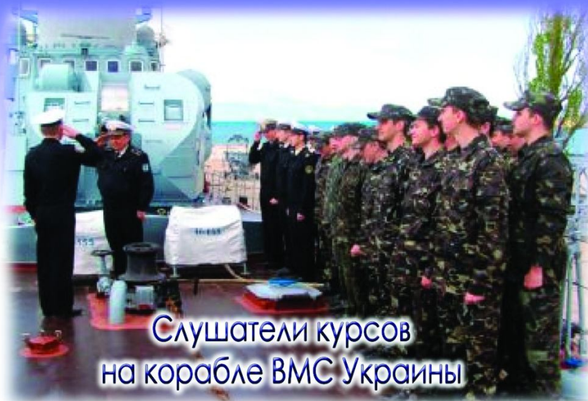
Слушатели курсов на корабле ВМС Украины

Студенты имеют возможность обучения на курсах военной подготовки офицеров запаса, по окончании которых они получают офицерское звание.